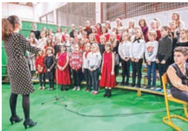
Združeni otroški pevski zbori OŠ Naklo