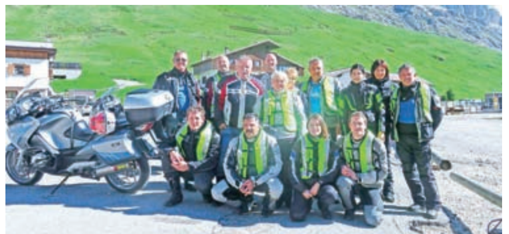
V italijanskih Dolomitih

Vsem motoristom in drugim udeležencem v prometu želimo vesele praznike in vse dobro v letu 2020 ter varno na cesti – previdno, strpno in trezno.