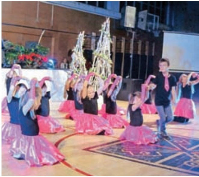
Frajle in frajer med nastopom

Dijaki centra, tako sedanji kot tudi nekateri nekdanji, so pod vodstvom mentorjev pripravili pester glasbeni, pevski in plesni program. Zaplesale so plesne skupine Frajle in frajer z Osnovne šole Naklo, Smeške s Podružnične šole Duplje in Rožice s podružnične šole v Podbrezjah. Pod vodstvom Mate-