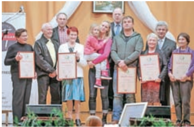
Prejemniki priznanj za najlepše urejene hiše v Dupljah.