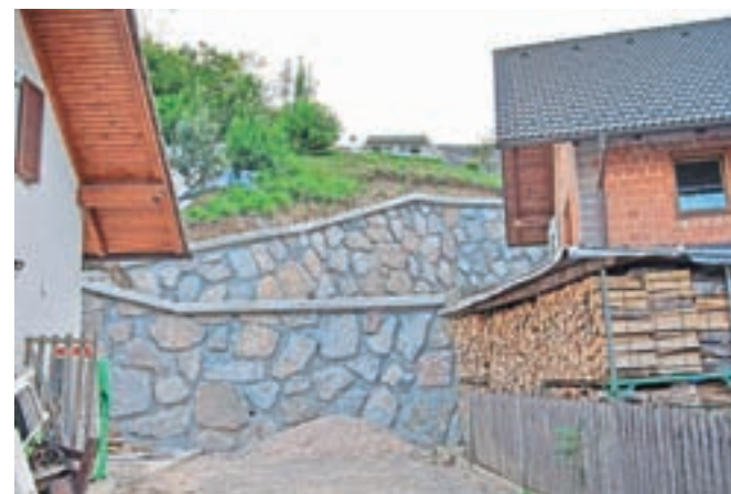
Močna in lepa škarka je bila v veselje obeh družin zaključena 12. avgusta 2019.