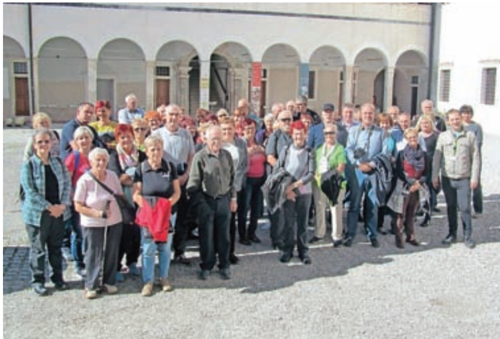
Člani Krive jelke pred brežiškim gradom

kom in pesnikom Tonetom Pavčkom. Prvi je bil doma v Jordankalu nad Mirno Pečjo, drugi pa na nasprotni vzhodni strani avtomobilske ceste proti Zagrebu, v Šentjuriju. Oba so počastili z obiskom Slakovega in Pavčkovega muzeja v Mirni Peči. Slakova družina je celotno Lojzeto glasbeno zapuščino podarila v muzeju, Pavčkovi pa ohranjajo večino spomina na velikega pesnika v rojstnem kraju Šentjurij na Dolenjskem. Po skoraj enournem srečanju s Slakovo življenjsko in glasbeno zgodbo so se »krivojelkarji« povzpeli nadstropje višje, kjer je vzorno urejen čebelarški muzej.