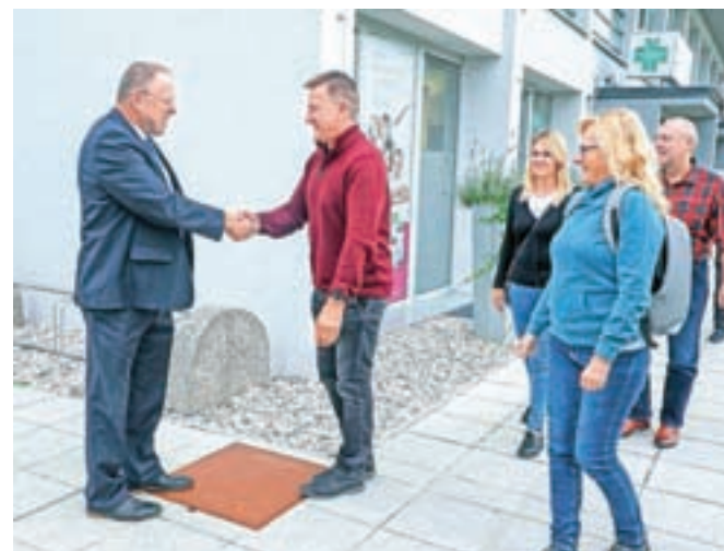
Prisrčno snidenje obeh županov in preostalih članov poljske delegacije

Bolero v Naklem, kar dvanajst nakelskih svetnikov se ga je udeležilo. Poljska delegacija si je ogledala proizvodno Orodjarstva Knific, Biotehniški center Naklo, šolo, vrtec, krajevno knjižnico ... in na lastno željo tudi center za ločeno zbiranje odpadkov v Naklem. Popeljali so jih še po znamenitostih domače občine in širše po Gorenjskem. Oba župana pričaku-