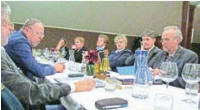
Srečali so se konec novembra v Boleru v Naklem.