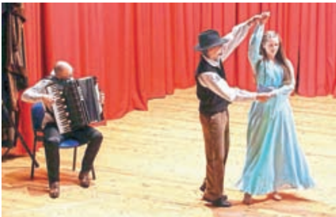
Večer pod zeleno lipo je ponovno navdušil.