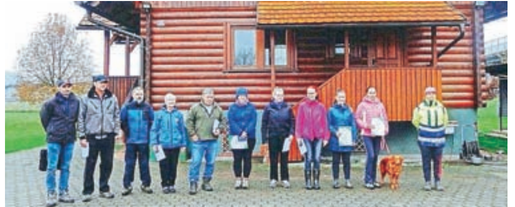
Kinološko društvo (KD) Naklo je tečajnikom za njihov uspeh podelilo diplome.

Naklo – Tako kot vsako leto smo tudi letos na začetku septembra organizirali drugi del vpisa v različne pasje tečaje, pred tem pa smo pripravili dan odprtih vrat, ki je privabil številne obiskovalce. Nekateri so se potem vpisali tudi v tečaje, na voljo so imeli malo šolo in osnovni tečaj. Ta se zaključuje z uradnim izpitom, za kar Kinološka zveza Slovenije izda uradno potrdilo, s katerim vodnik pridobi naziv »vodnik psa spremljevalca«, pes pa naziv »pes spremljevalec«. Izpit so po nekaj manj kot treh mesecih obiskovanja tečaja opravili li vsi tečajniki programa IPS A in IPS B-BH. Sodnik Kinološke zveze Slovenije jih je dodatno pohvalil, na kar smo v društvu še posebno ponosni, tečajniki pa prav tako, saj so morali v teh treh mesecih kar trdo delati, da so usvojili vse potrebno znanje (izpit je sestavljen iz teoretičnega