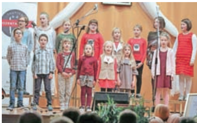
Otroški pevski zbor Podružnične šole Duplje