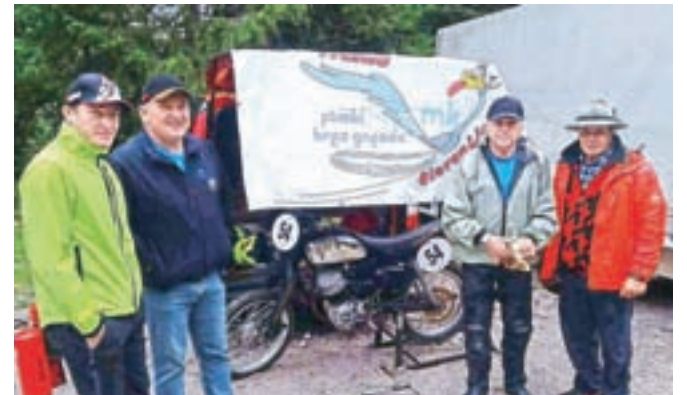
Na dirki starodobnikov na Ljubelju

S prvomajsko budnico po občini Naklo smo stopili v mesec, ki je za naš klub največji zalogaj – zaradi prireditve Moto dan v Naklem, osme po vrsti. Ker nam je na prvotni termin zagodlo vreme, smo prireditev prestavili na drugi termin. Kljub slabi napovedi smo ga uspešno izvedli. Glavna tema je bila varnost vseh udeležencev v prometu, ne samo motoristov. Postavili smo poligon, na katerem je policist motorist pokazal večšine, ki bi jih moral znati vsak motorist. Motoristi so nato imeli možnost, da te večšine preizkusijo pod budnim očesom in napotki policista motorista. Imeli smo kar nekaj stojnic, na katerih smo si lahko ogledali različno motoristično opremo. Prikazali smo preizkus delovanja »airbaga« (zra-