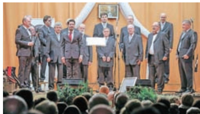
Moški pevski zbor KUD Triglav Duplje

vidim, da nas tudi po 23 letih, kar deluje društvo, še vedno veže ista ljubezen do naših krajev, da imamo toliko stvari pokazati," je poudaril župan. Je pa Jože župana vprašal tudi, ali je razmišljal o tem, da bi na domač oder postavili igro o Rokovnje funkcije uspešno vodil to društvo. "Bilo bi zanimivo," se je glasil odgovor.