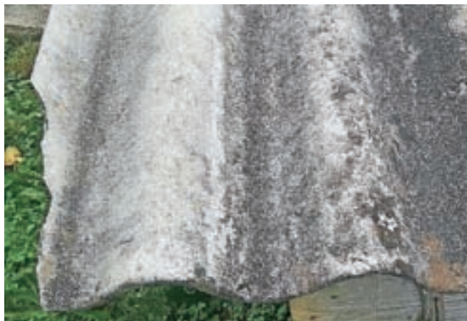
Nevarna azbestna vlakna z vdihavanjem vdrejo v pljuča.