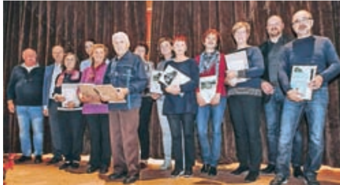
Prejemniki priznanj za najlepše urejene domove in vrtove v Naklem